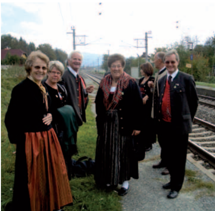
Fahrt mit dem Zug nach Klagenfurt