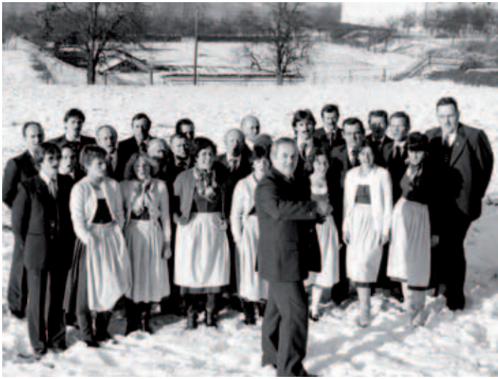
Eine Chorprobe unter freiem Himmel im Winter 1981