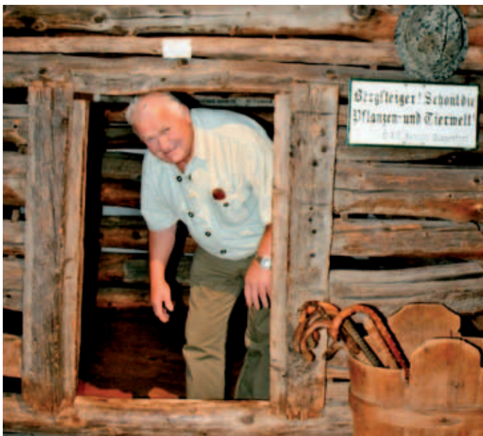
2008 – Ausflug ins Volkskundemuseum in Spittal/Drau