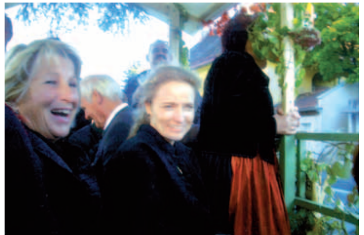
... direkte Heimfahrt mit dem reparierten Traktor und Festwagen