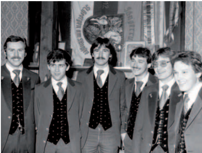
Der flotte Nachwuchs ...