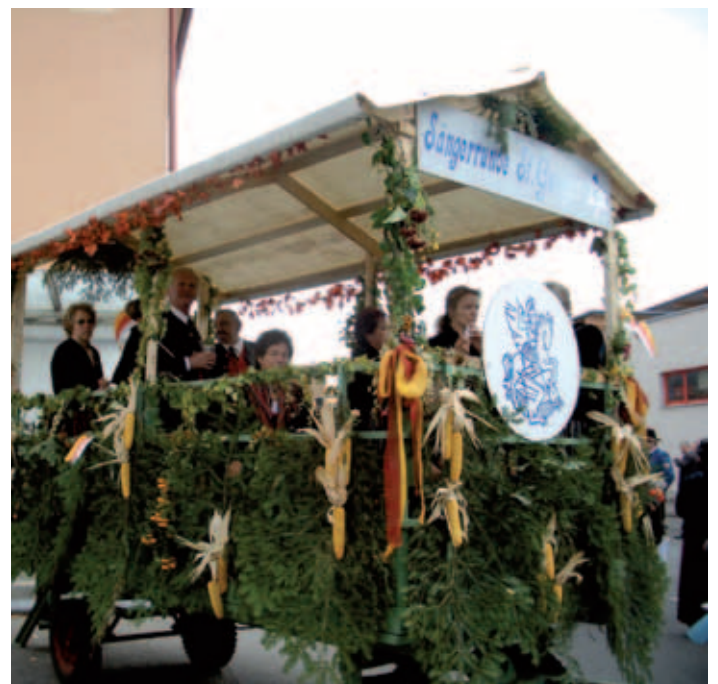
2010 – 10. Oktoberfeier 100 Jahre Kärntner Volksabstimmung