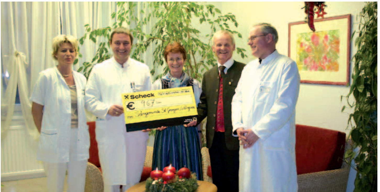
2006 – der Reinerlös des Adventkonzertes kommt der Palliativstation des Krankenhauses Barmherzige Brüder/St. Veit zugute.