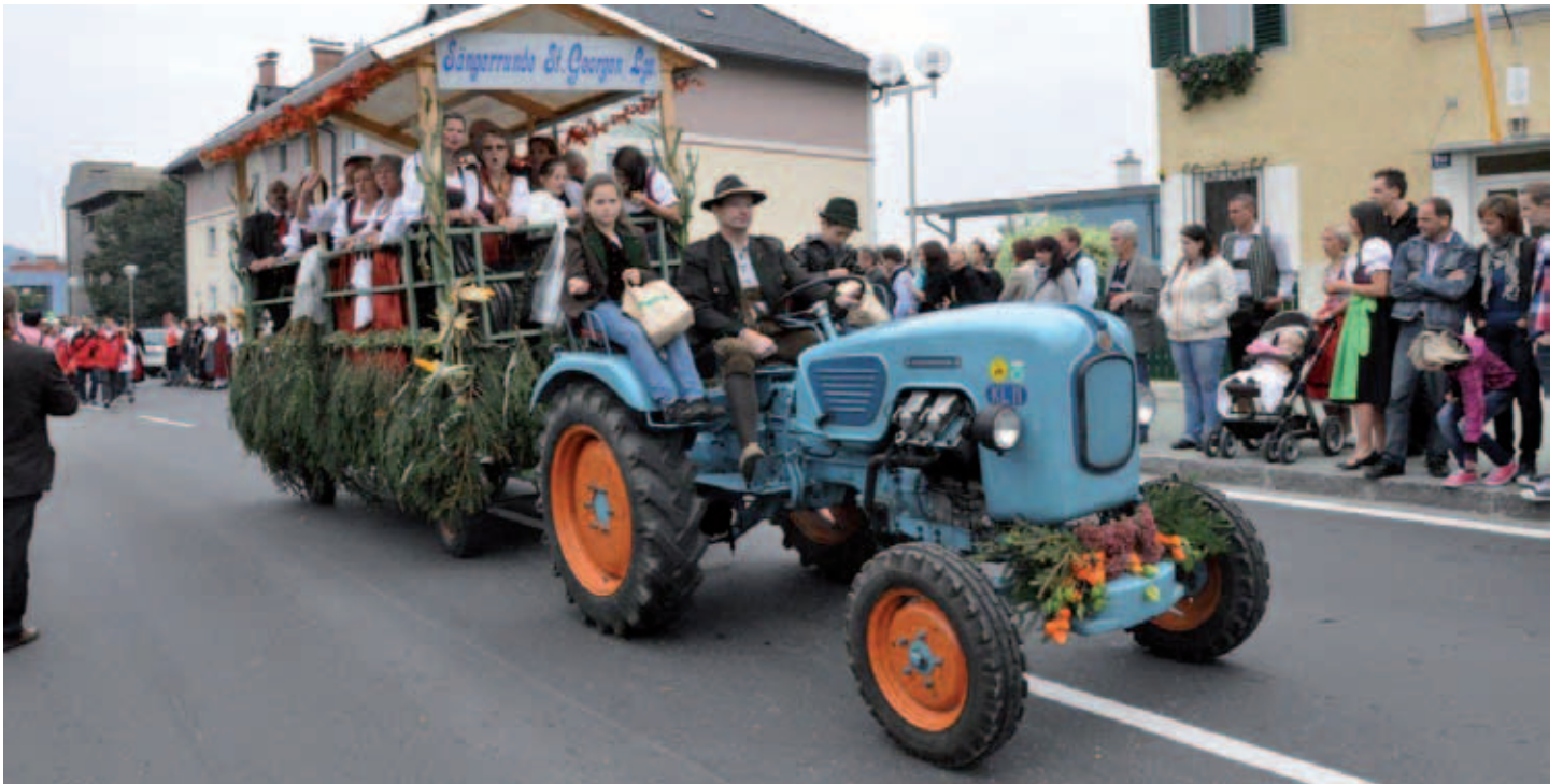
2011 – Wiesenmarkt-Umzug