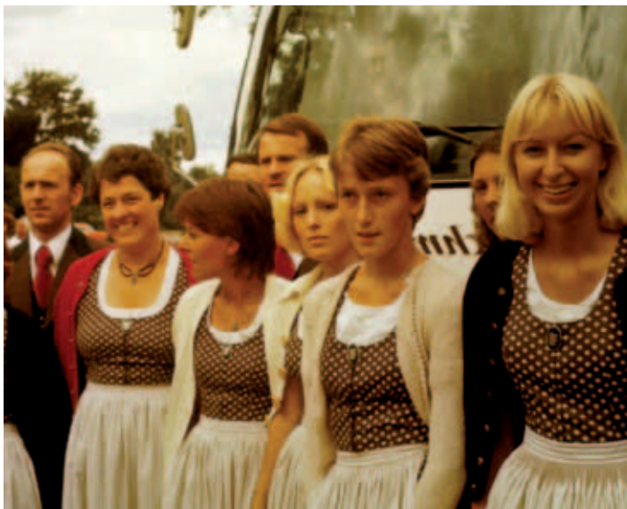
... aber auch unsere Damen können sich sehen lassen