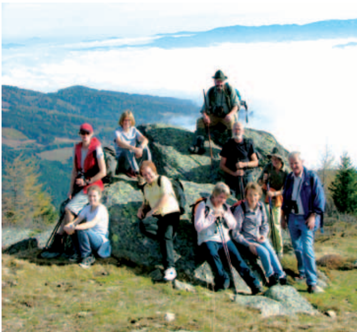
Erstmal eine kleine Pause auf der Saulpe ...