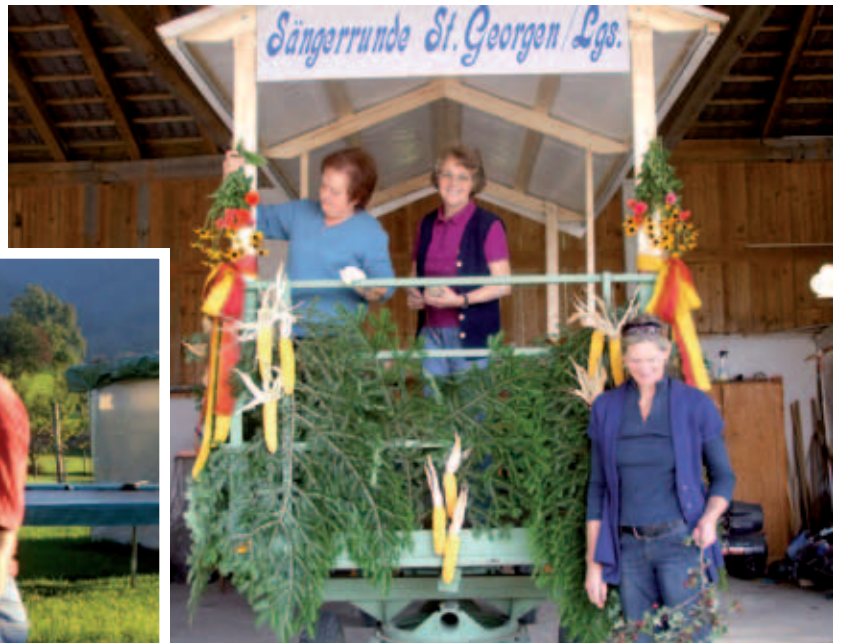
... und die Damen verpassen den letzten Feinschliff.