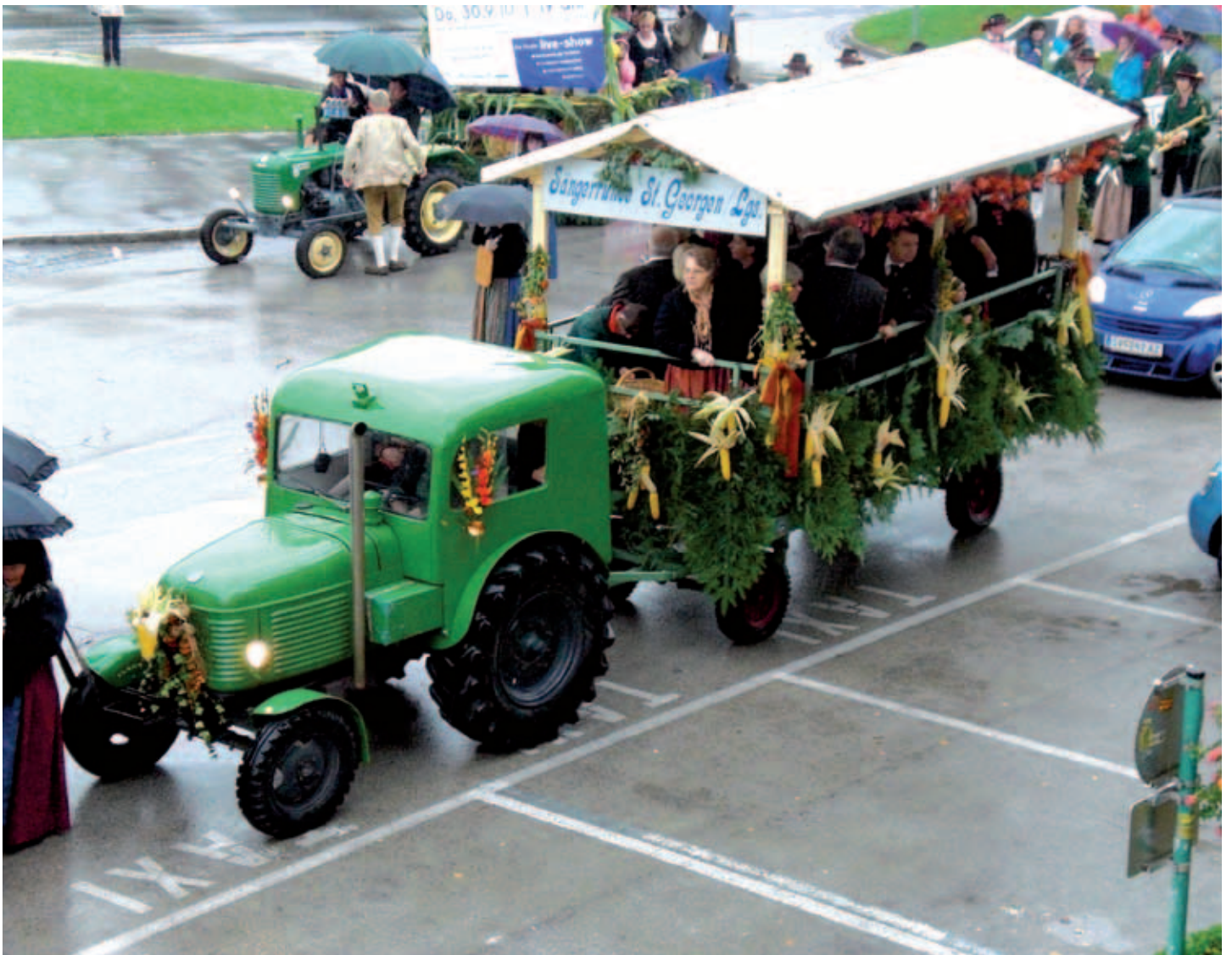
2010 – Wiesenmarkt-Umzug – mit dem neuen Dach kann uns der Regen nichts anhaben ...