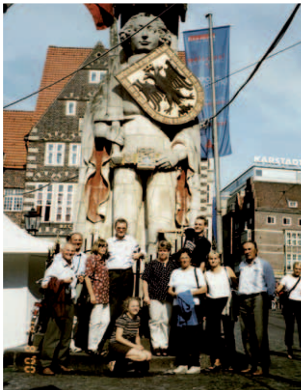
2000 - Sängerschaft nach Bremen Gruppenfoto vor dem „ROLAND“