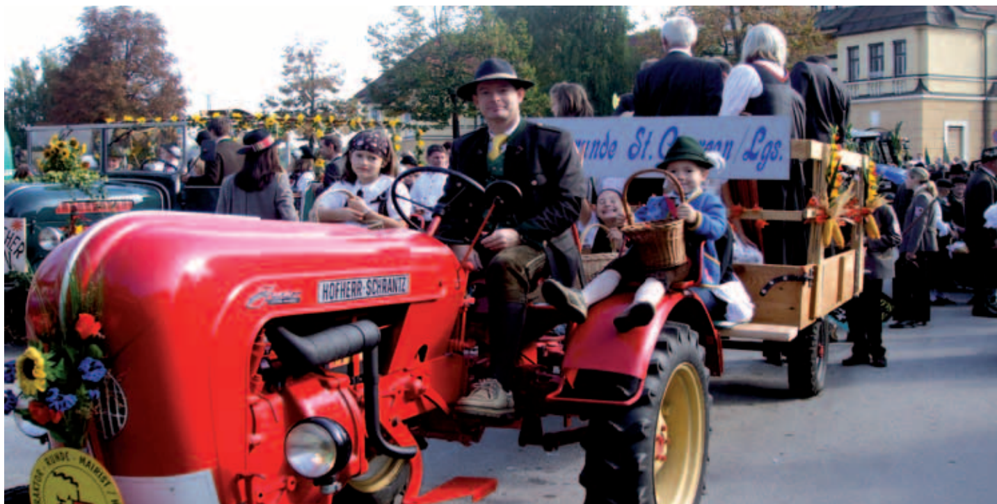
2009 – Teilnahme Wiesenmarkt-Umzug St. Veit