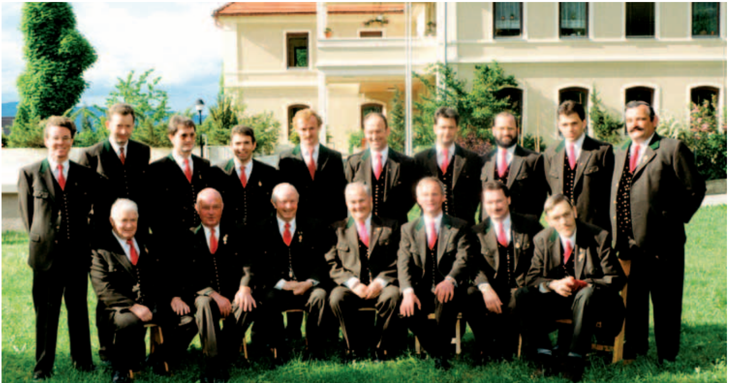
Männerchor 1994 - im Garten der Volksschule St. Georgen am Längsee