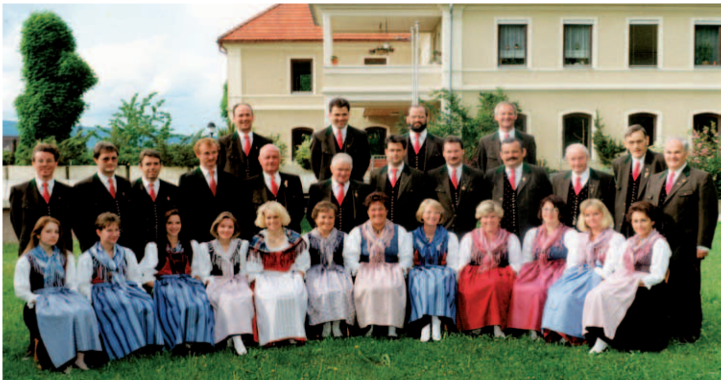
Gemischter Chor - 1994