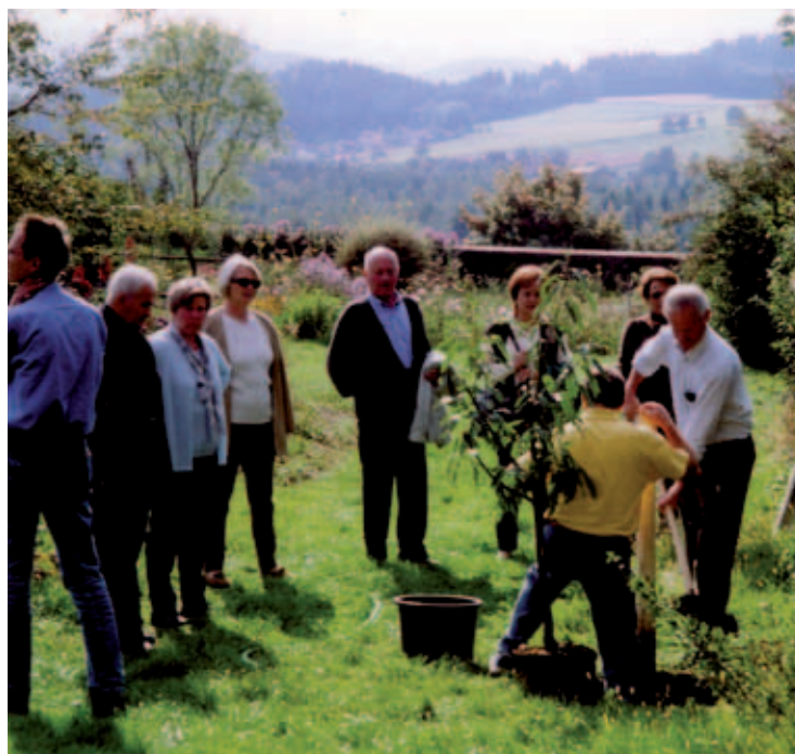
2001 – Ein Maronibäumchen, das Gastgeschenk vom SK Gedersberg, wird eingepflanzt. Es bekommt einen würdigen Platz im schönen Schlossgarten.