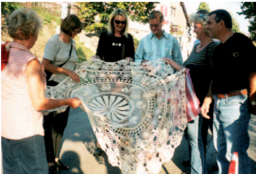
Echte Handarbeit – kann man da widerstehen?