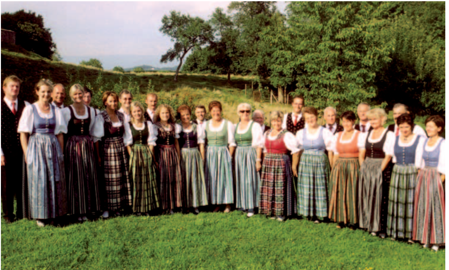
2003 – Sängersfest beim Liegl – Im Mittelpunkt standen die Damen mit ihren neu angeschafften Dirndlkleidern.