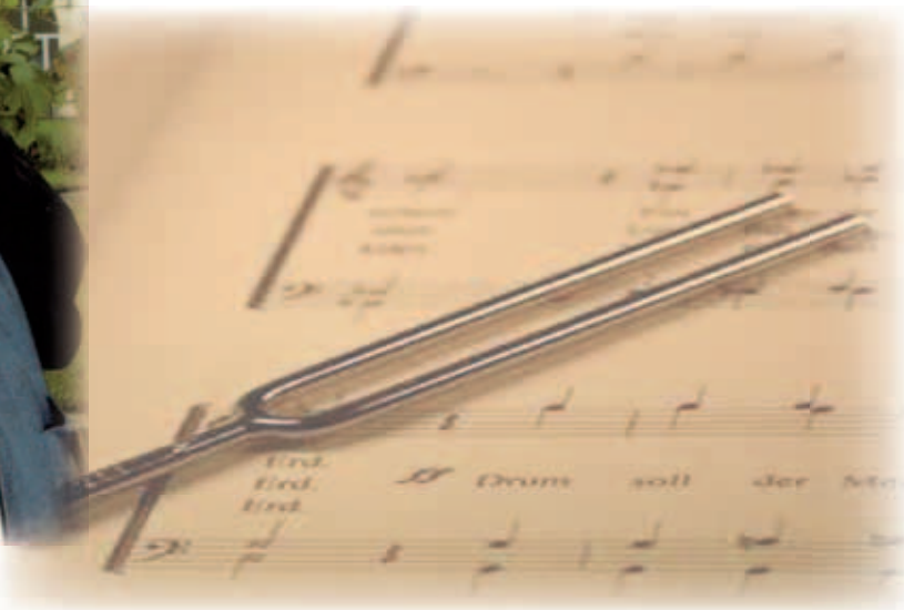
Hier Fotos von seiner 70. Geburtstagsfeier.

Beachtliche 42 Jahre dirigierte er die Sängerrunde mit großem Erfolg und musikalischem Geschick.