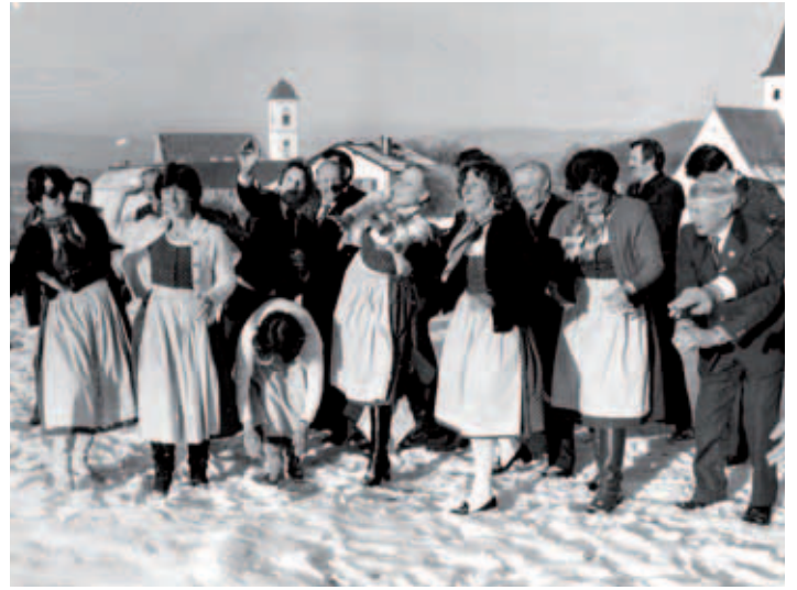
Schneeballschlacht im Winter 1981