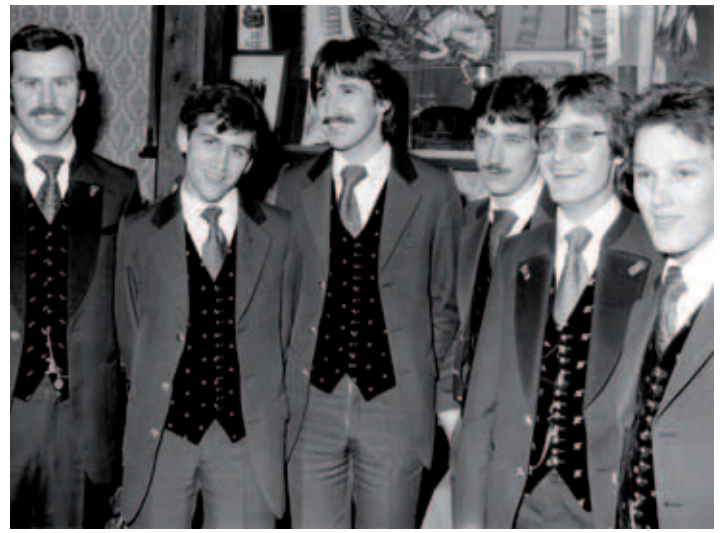
... eine Augenweide!