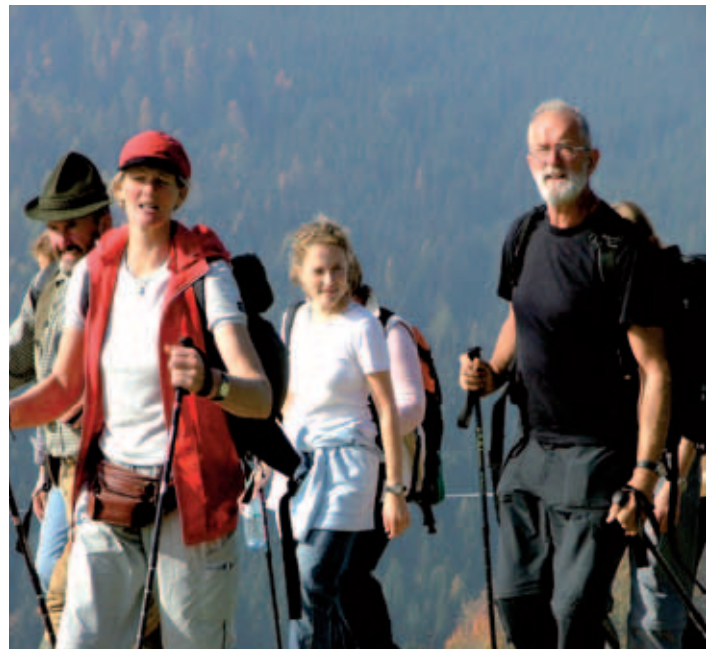
... und weiter geht's!