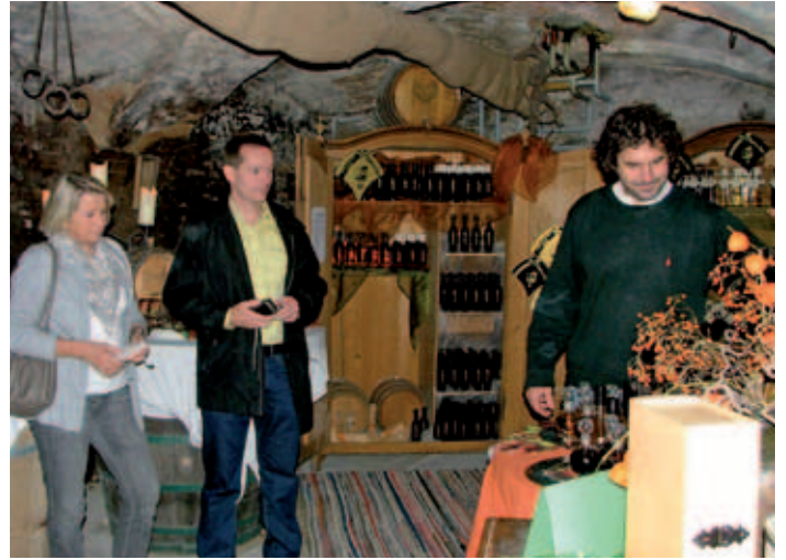
Ausflug der Sängerrunde in die Südsteiermark.