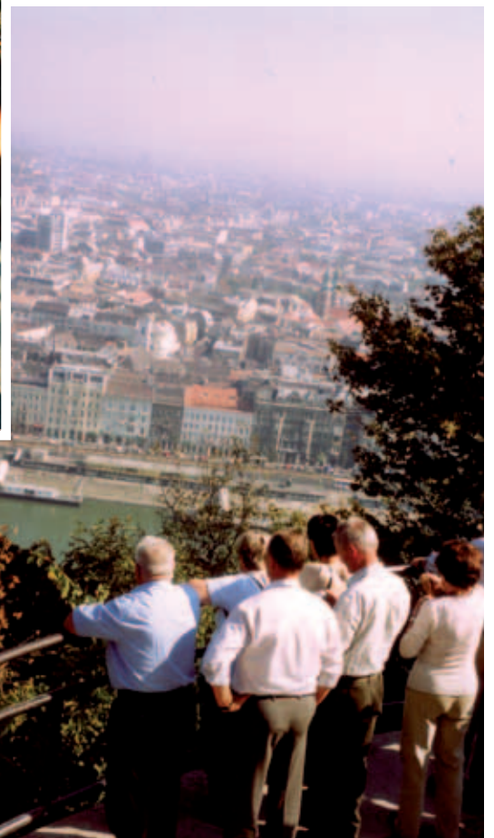
Ausflug nach Budapest 2003