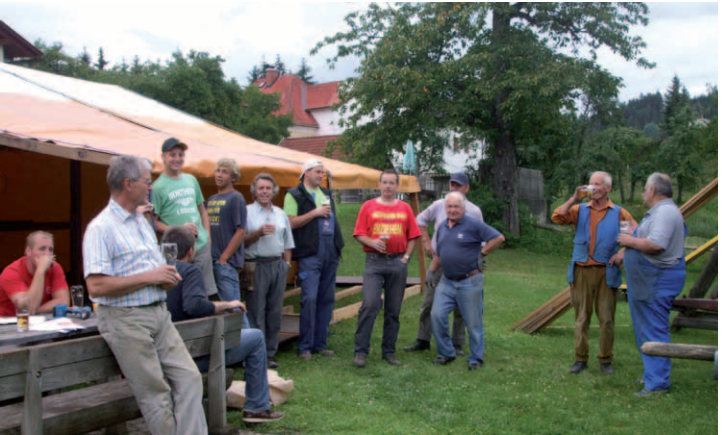
2011 – Zeltaufbau zum Sängerfest – die Sänger haben sich das Bier redlich verdient!