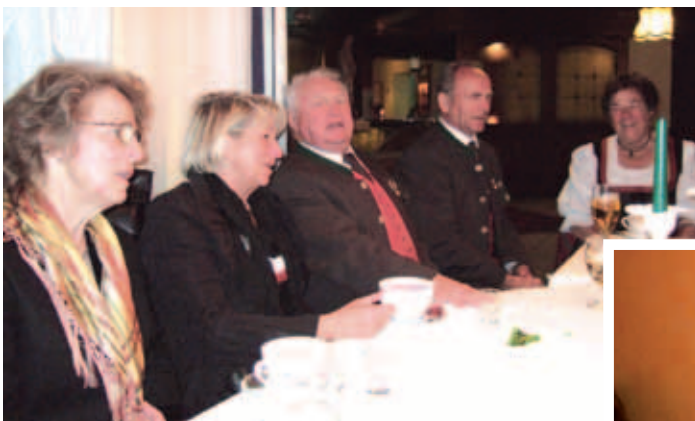
– Endstation GH SCHUMI