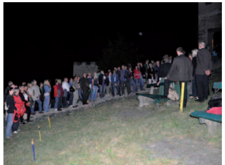
2011 – Vollmondwanderung auf die Burg Hochosterwitz