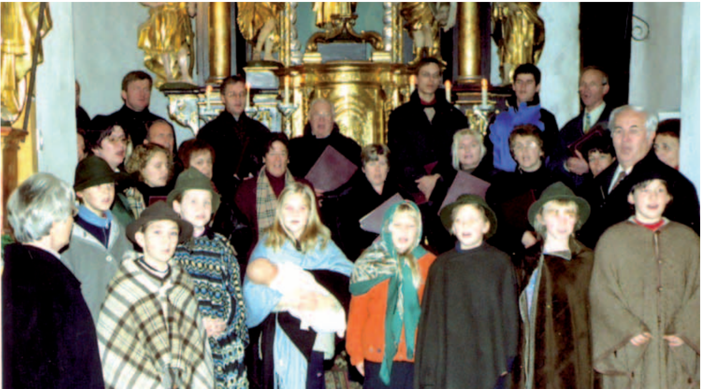
Adventsingen 2002 – In der Kirche St. Peter/Taggenbrunn – mit den Kindern der VS St. Georgen/Lgs.