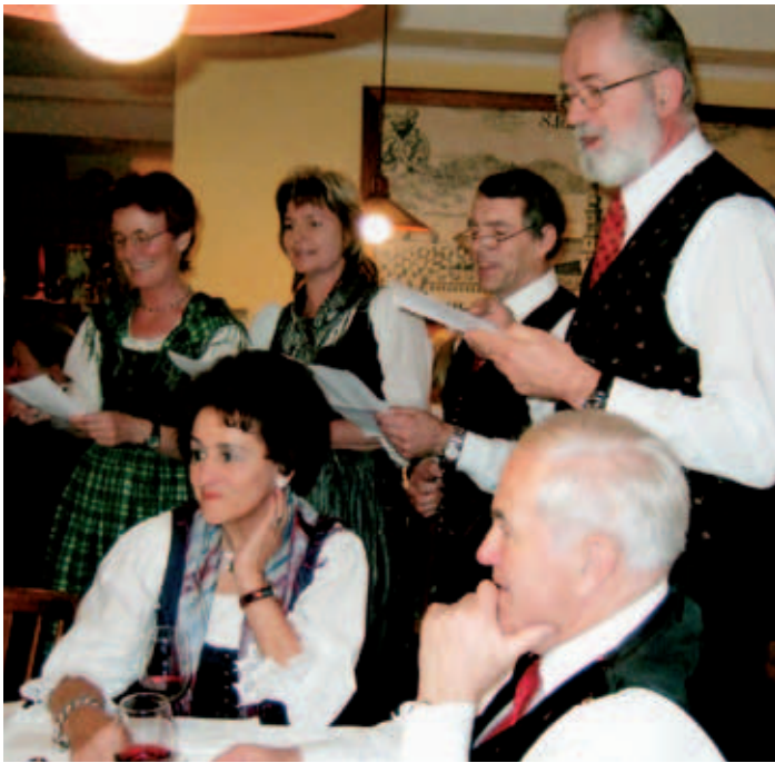
2006 – Ein Ständchen in Ehren ...