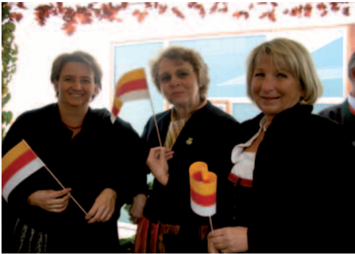
Endloses warten auf den Beginn ...