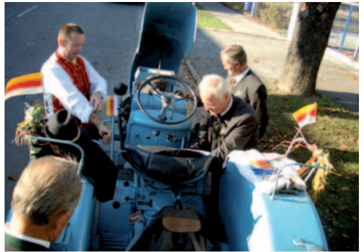
doch nach 200 m, bereits die erste Traktorreparatur ...